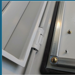
방수 절곡, 힌지