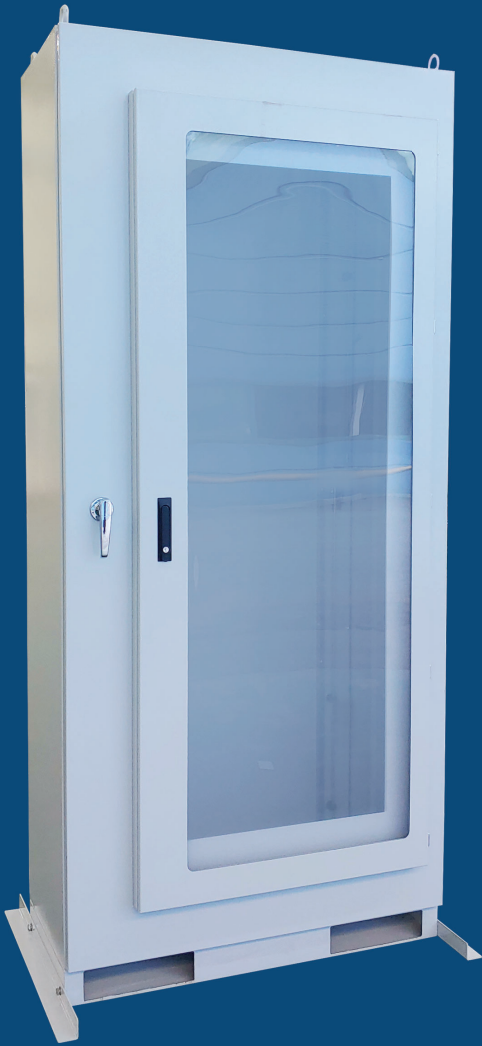
※ 서브도어, 핸들, 베이스는 옵션사항입니다.